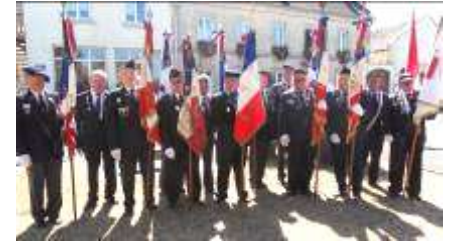
Présence de 11 Porte-drapeaux