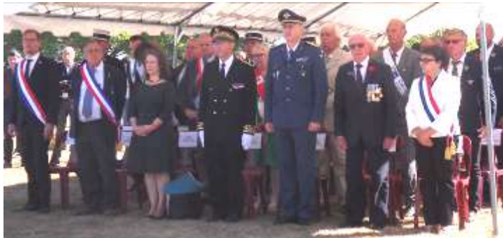
Présence d'autorités civiles et militaires