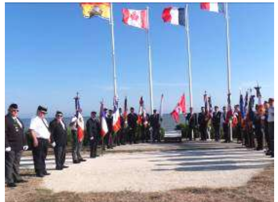
Présence de 16 Porte drapeaux