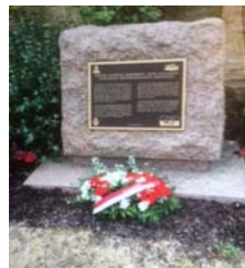
Stèle des canadiens