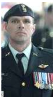
Colonel Jean-Pascal LEVASSEUR Attaché de Défense