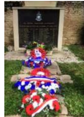
Stèle avec le nom des 22 membres du 46 ème RMC tués au combat