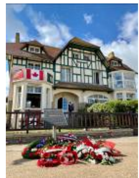
Cérémonie d'hommage au Queen's Own Rifles of Canada