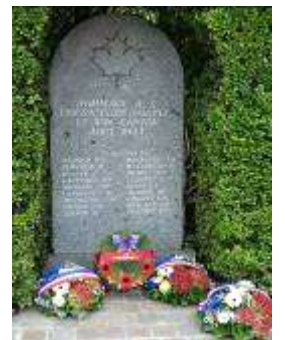
Stèle des Canadiens