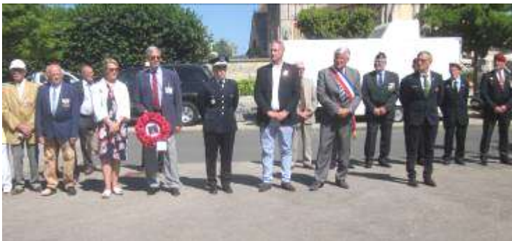
Présence d'autorités civiles et militaires