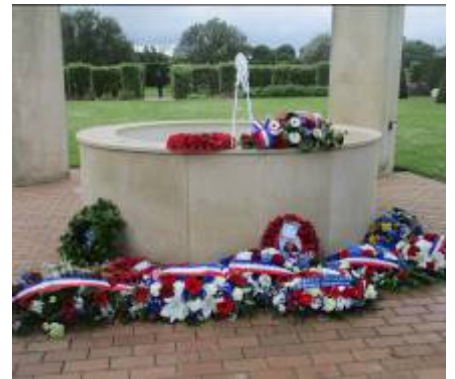
Dépôt de gerbes par les autorités civiles et militaires au Jardin britannique du Souvenir au Mémorial de Caen