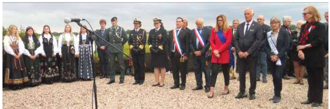
Personnalités civiles et militaires