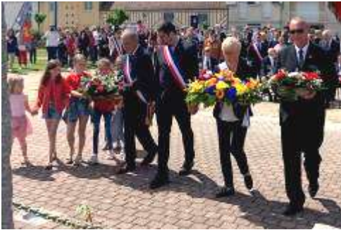
Dépôt de gerbes devant la stèle