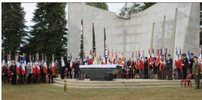
Messe célébrée en plein air en hommage aux soldats polonais Présence de 41 Porte drapeaux