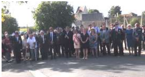
Personnalités civiles et militaires