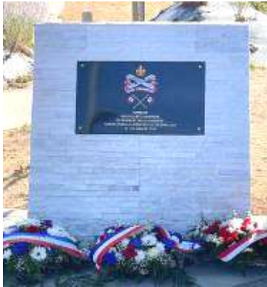
Hommage aux soldats du Régiment de la Chaudière