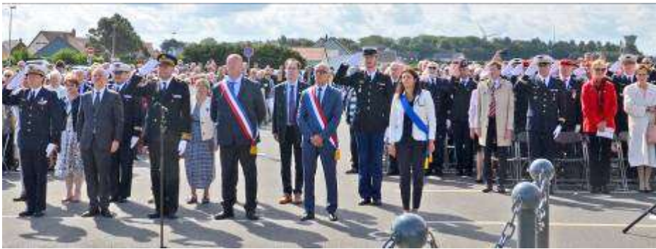
Présence de personnalités civiles et militaires à l'inauguration d'un monument en l'honneur aux 123 aviateurs disparus de la France Libre