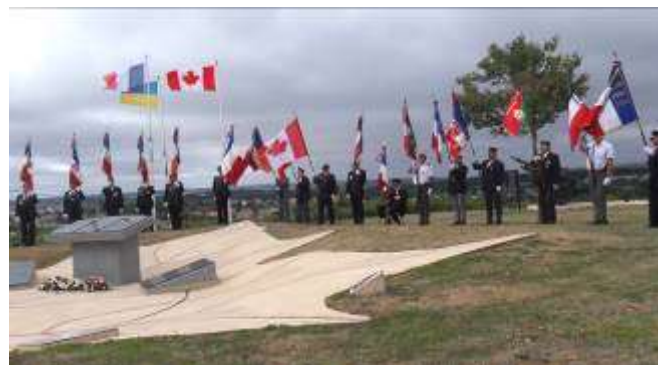
Présence de 17 Porte-drapeaux