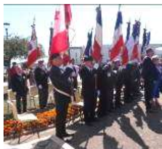
Présence de 24 porte drapeaux