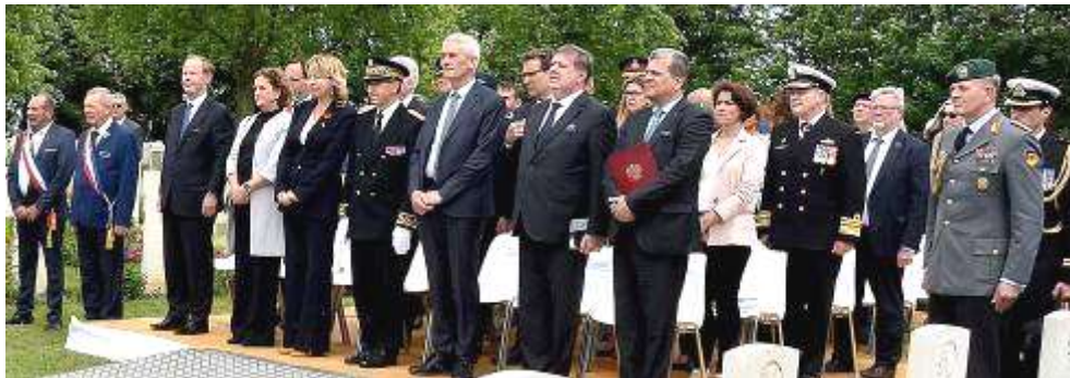
Autorités civiles et militaires