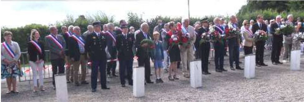
Autorités civiles et militaires au monument St-Clair