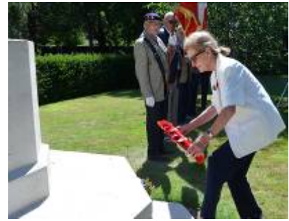
Dépôt de gerbe