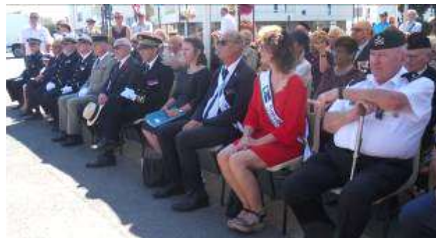
Personnalités civiles et militaires