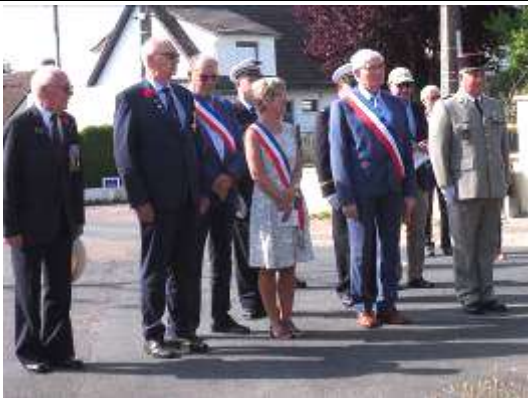
Cérémonie en hommage aux Canadiens