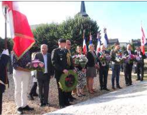
Dépôt de gerbe devant la stèle des Canadiens