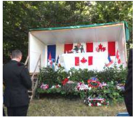
Messe en en hommage aux Canadiens