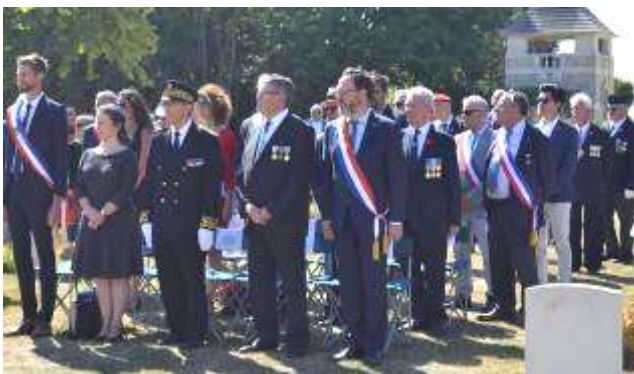
Personnalités civiles et militaires