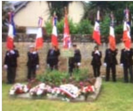
Place Alphonse Noël