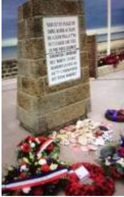
Stèle des Canadiens