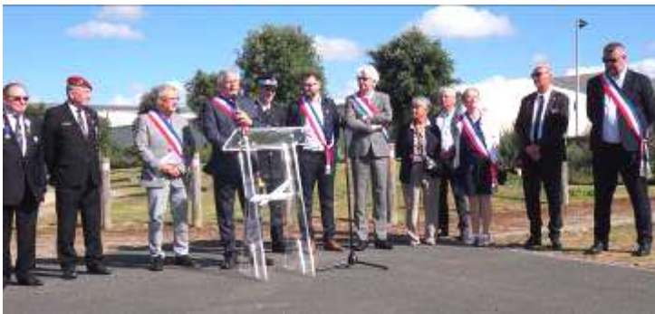
Présence d'autorités civiles et militaires