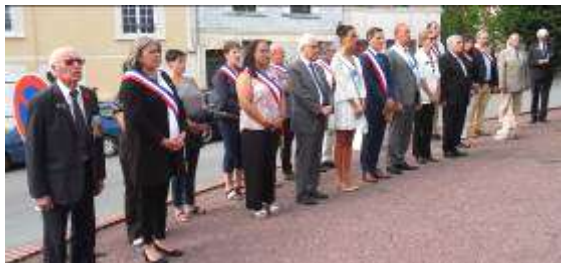
Personnalités civiles et militaires