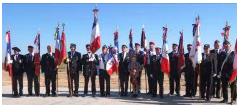
Présence de 15 Porte drapeaux