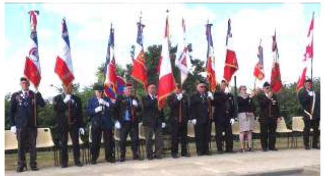
Présence de 11 Porte drapeaux