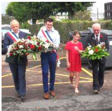
Dépôt de gerbes devant la stèle Rue du Régiment Maisonneuve