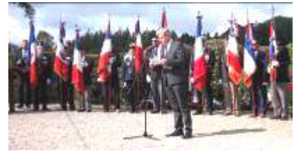
Présence de 21 Porte drapeaux