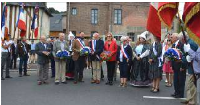
Dépôt de gerbe en hommage aux libérateurs