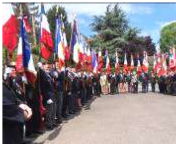
Présence de 34 Porte drapeaux