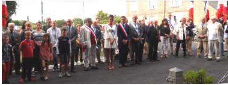
Personnalités civiles et militaires