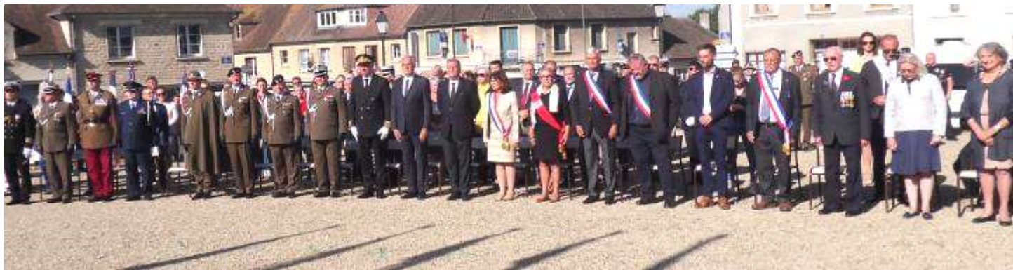
Personnalités civiles et militaires