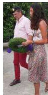
Dépôt de gerbes devant la stèle Square rue Serge Rouzière