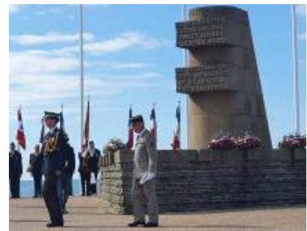
Monument Signal - Place du 6 juin