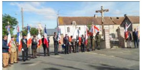
Présence de 13 Porte-drapeaux