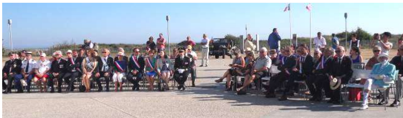
Personnalités civiles et militaires