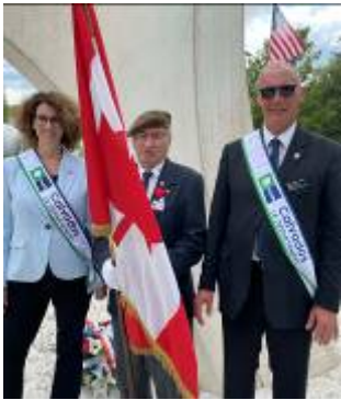
Rond point de la gare