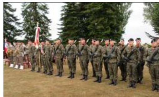
Musiciens et militaires polonais