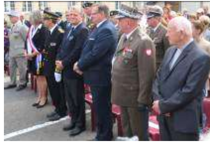
Personnalités civiles et militaires