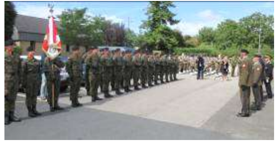
Soldats et musiciens polonais