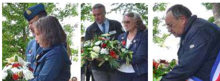
Hommage aux fusiliers canadiens