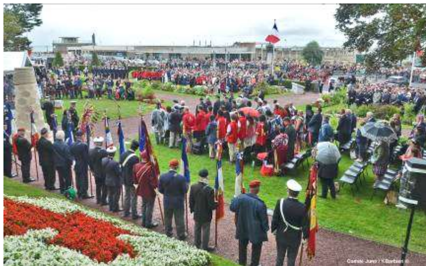
Cérémonie canadienne au Square du Canada