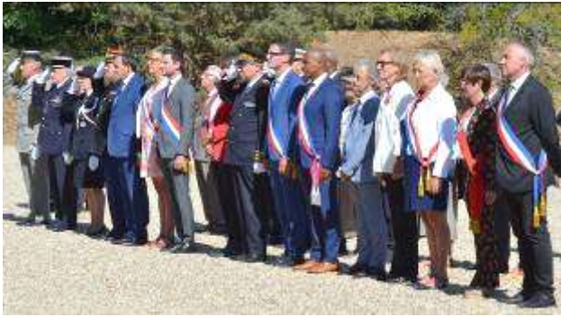
Dépôt de gerbe au monument des Martyrs de la résistance