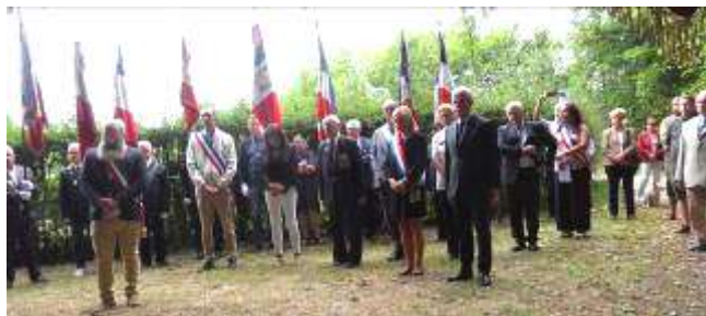
Personnalités civiles et militaires Présence de 24 Porte drapeaux