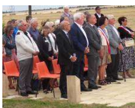
Autorités civiles et militaires