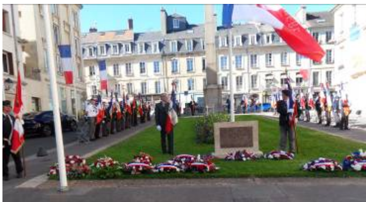
Présence de 31 Porte drapeaux