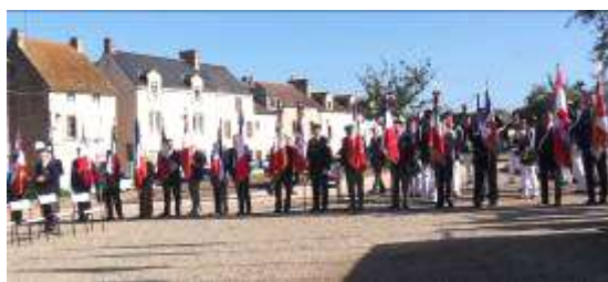
Présence de 36 Porte drapeaux