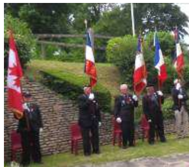
Présence de 5 Porte drapeaux