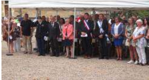
Personnalités civiles et militaires