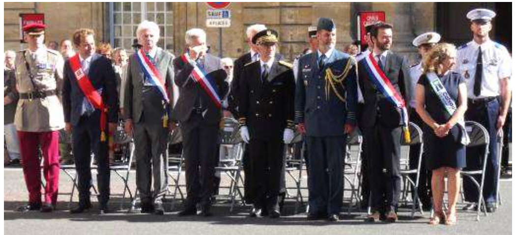
Autorités civiles et militaires