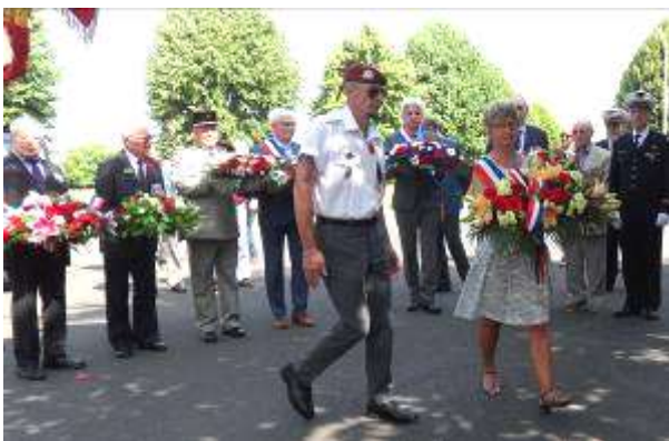
Dépôt de gerbes en hommage aux Canadiens