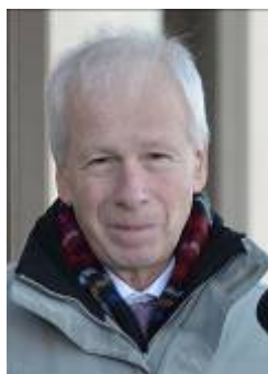
L'honorable Stéphane DION Ambassadeur du Canada auprès de la France