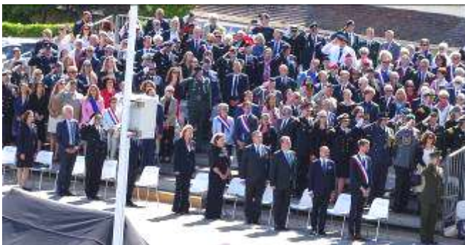
Autorités civiles et militaires