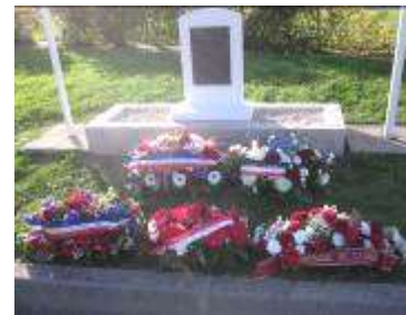
L'Assemblée Générale a été précédée d'une cérémonie avec dépôt de gerbes au monument du Régiment de la Chaudière