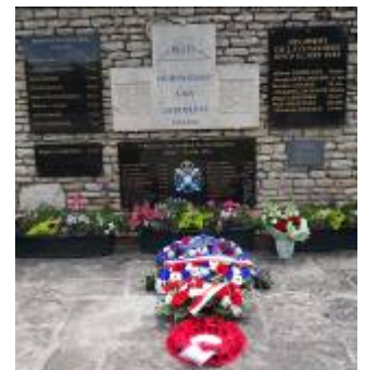
Stèle des Canadiens