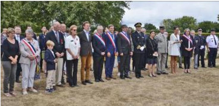
Personnalités civiles et militaires au cimetière du Commonwealth