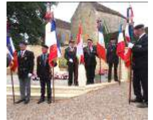
Présence de 16 Porte-drapeaux