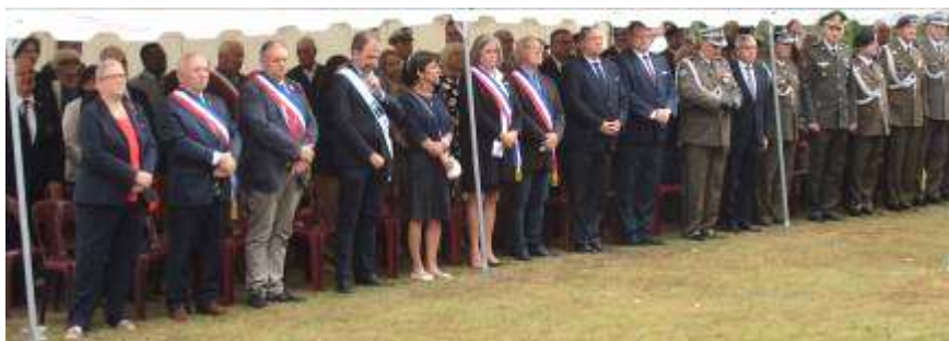
Personnalités civiles et militaires