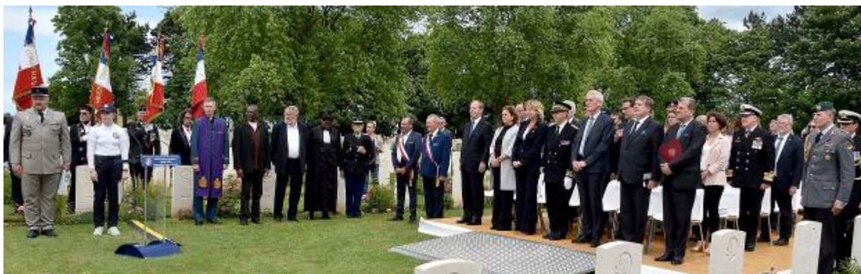
Cimetière militaire de Bénvy-Revières le lundi 6 juin 2022

78 ème ANNÉE ANNIVERSAIRE DU DÉBARQUEMENT