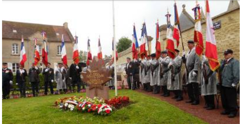
Présence de 17 Porte drapeaux