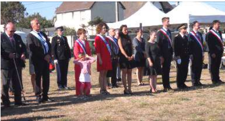
Présence d'Autorités civiles et militaires