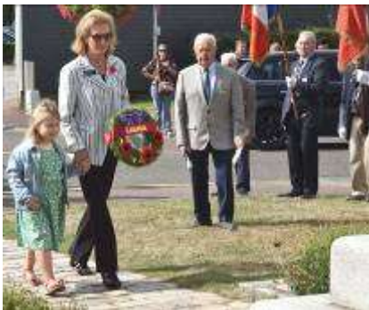
Dépôt de gerbe devant la stèle canadienne