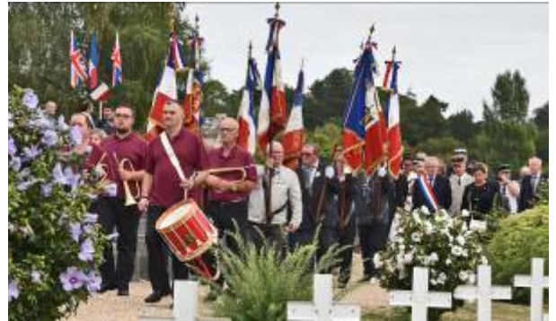
Musiciens et Porte drapeaux