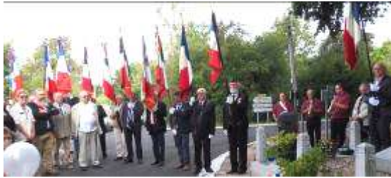
Présence de 24 Porte drapeaux