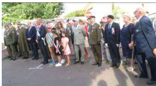
Personnalités civiles et militaires