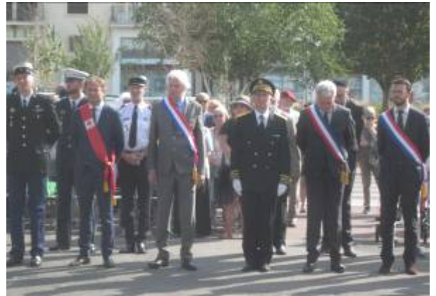
Hommage aux justes de France