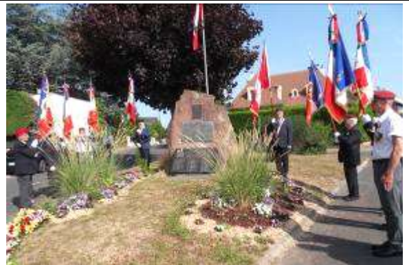
Présence de 8 Porte drapeaux devant la stèle des canadiens