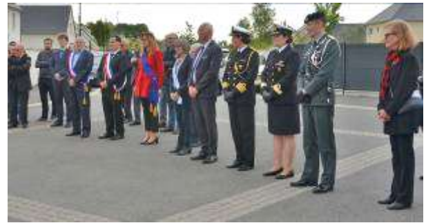
Personnalités civiles et militaires