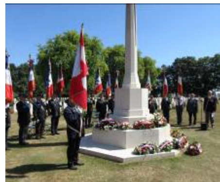
Présence de 14 Porte drapeaux