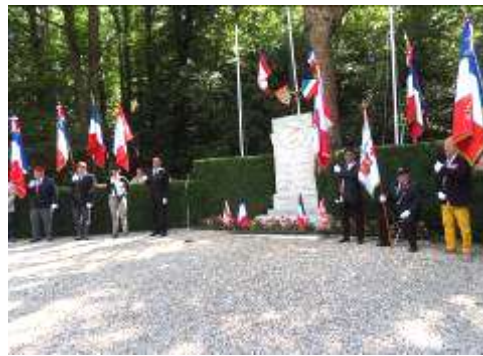
Présence de 8 Porte drapeaux