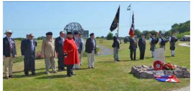
Commémoration britannique au Radar 44