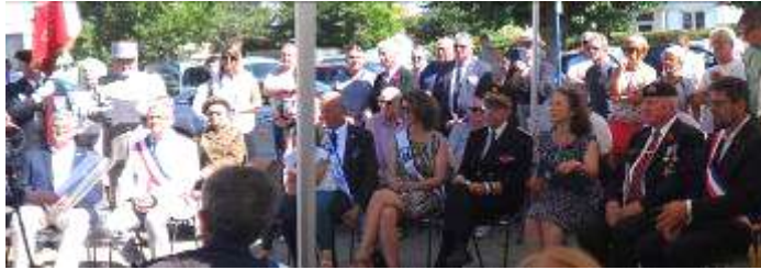
Personnalités civiles et militaires