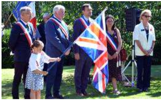
Présence d'autorités civiles