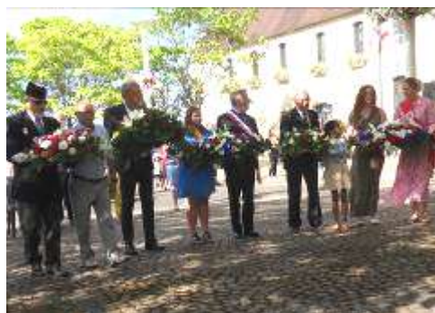
Autorités civiles et militaires