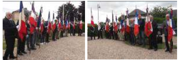
Présence de 24 Porte drapeaux