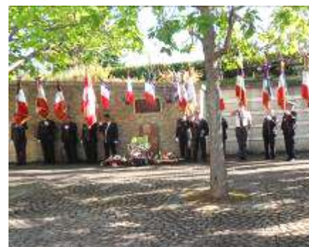
Présence de 12 Porte-drapeaux devant la stèle des Canadiens