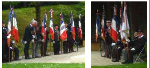
Présence de 14 Porte drapeaux