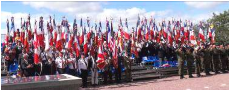
Présence de 93 Porte drapeaux