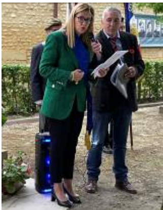
Mme Stéphanie YON-COURTIN Députée européenne