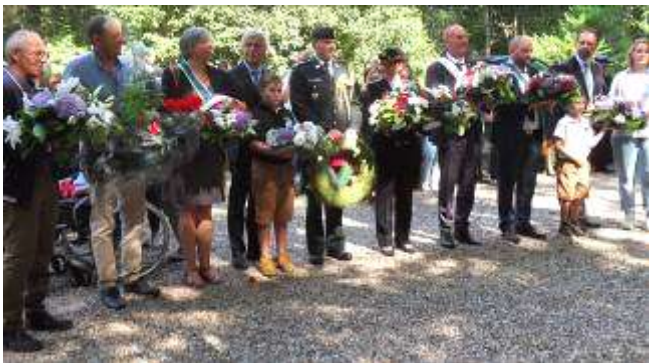
Personnalités civiles et militaires