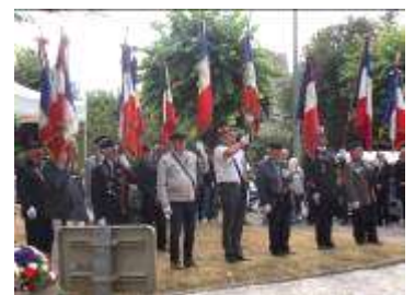
Présence de 19 Porte-drapeaux