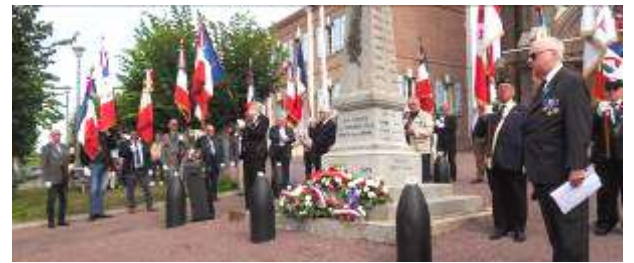
Présence de 27 Porte drapeaux