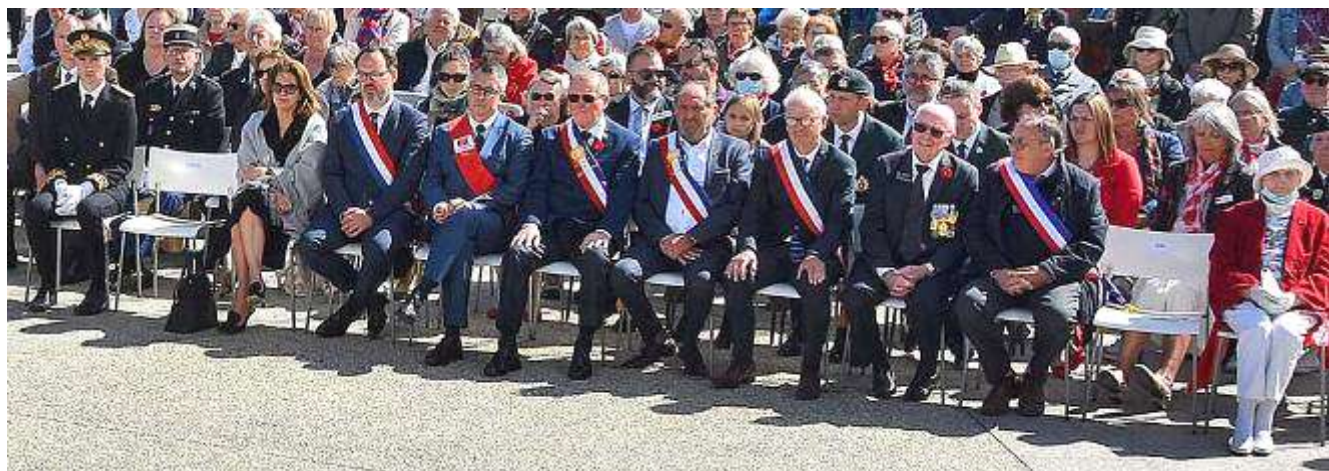
Autorités civiles et militaires