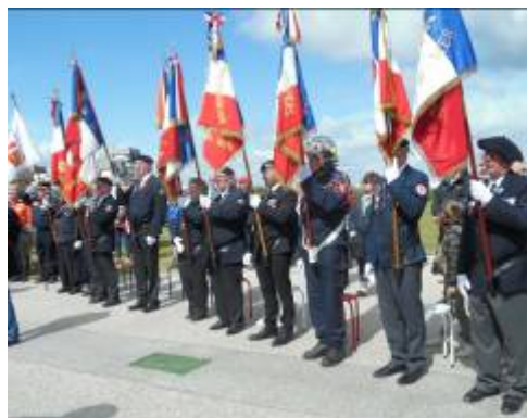
Présence de 10 Porte drapeaux