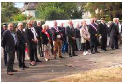
Personnalités civiles et militaires