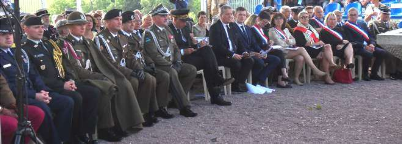
Personnalités civiles et militaires