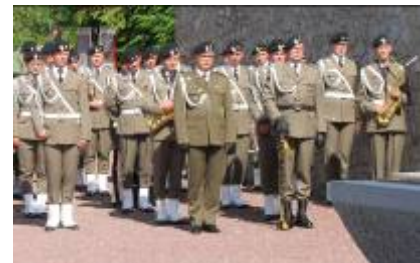
Orchestre militaire polonais de ZAGAN