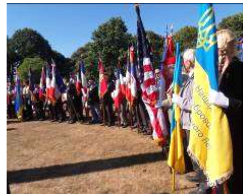
Présence de 43 Porte drapeaux