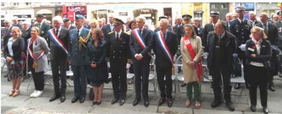
Personnalités civiles et militaires