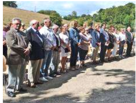
Cérémonie à la mémoire des Maquisards