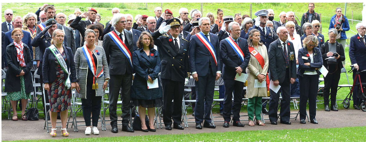
Mémorial de Caen au jardin des Canadiens le mardi 7 juin 2022