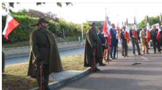
Présence de 13 Porte-drapeaux