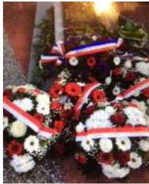
Place des canadiens